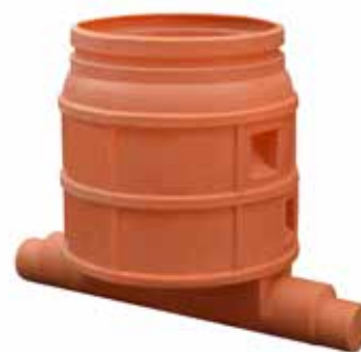
1 IN - 1 OUT