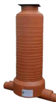
1 IN - 1 OUT