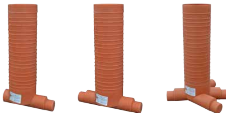
1 zonă IN- 1 OUT