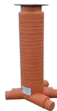
3 IN - 1 OUT