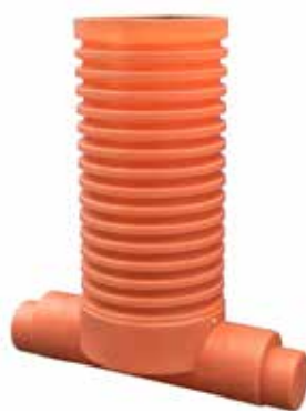
1 IN - 1 OUT