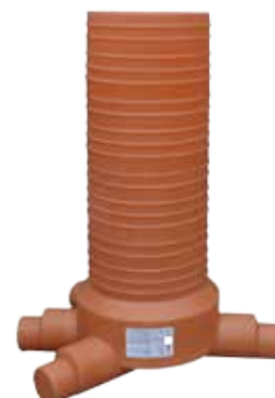
3 IN - 1 OUT