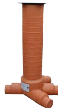
3 IN - 1 OUT