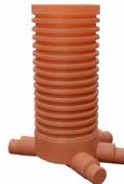
3 IN 45° - 1 OUT