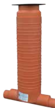
1 IN - 1 OUT