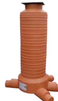
3 IN - 1 OUT