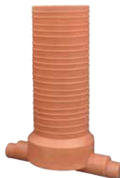
1 IN - 1 OUT