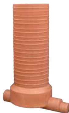
1 zonă - 1 OUT