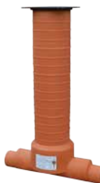
1 IN - 1 OUT