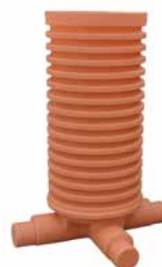
3 IN 90° - 1 OUT